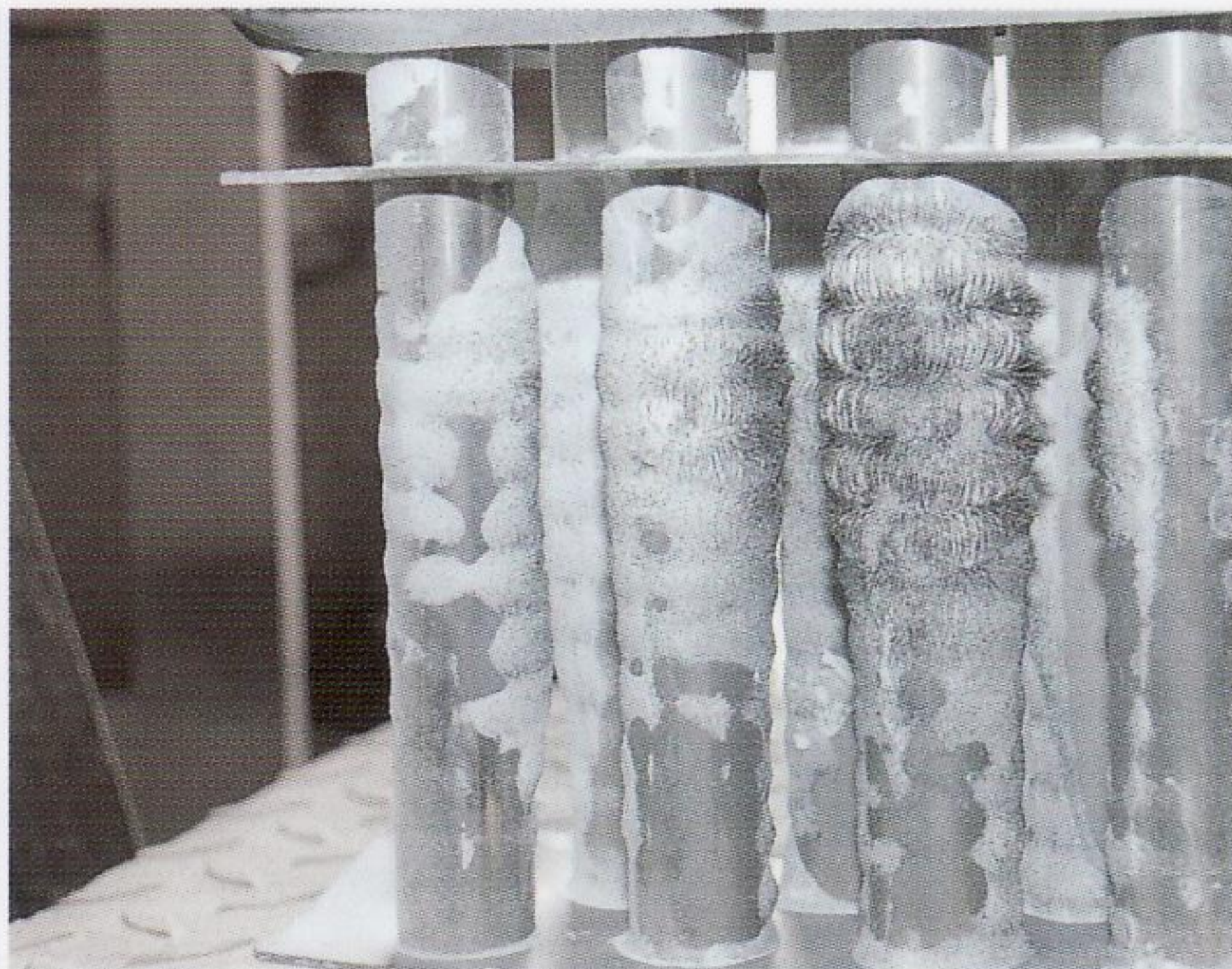
پنجره‌های مغناطیسی در انواع معمولی و ویژه تحت سفارش مشتری در ابعاد مختلف قابل ارائه می‌باشد.