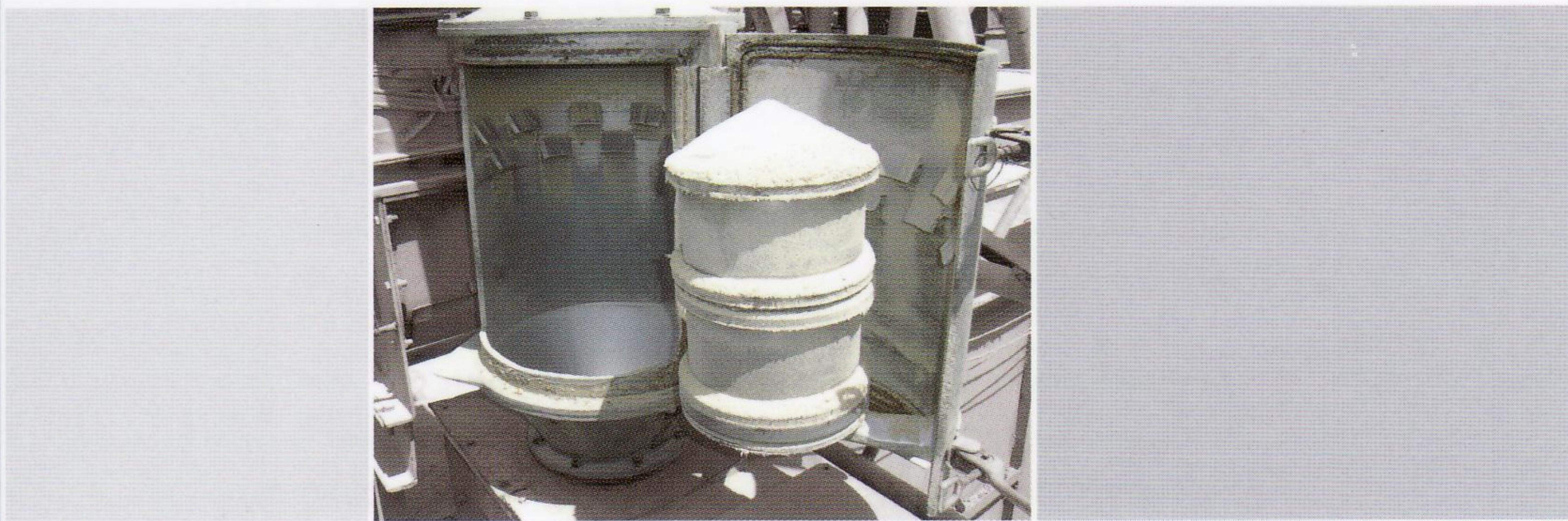
این نوع دستگاه هادر انواع مخروطی و تخت تحت سفارش مشتری در مدل های مختلف قابل ارائه می باشد.