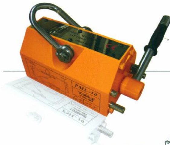
لیفتر مگنت دائم PERMANENT MAGNETIC LIFTER

We have the opinion of providing good quality and service, speeding up working process and lowering the costs.